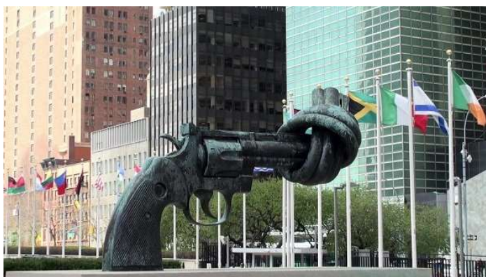
Non-violence devant le siège des Nations Unies

Au centre, la Liberté, qui porte un bonnet phrygien, brandit dans une main une chaîne brisée, signe de la fin de l'esclavage ; elle porte dans l'autre main un rameau d'olivier, symbole de paix. A droite, l'Egalité qui porte un niveau, prend la main de la Fraternité ; celle-ci est représentée par une esclave noire tout juste libérée de ses chaînes. Les trois figures dominent un globe