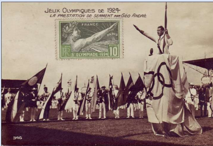
La prestation de serment par Géo André, Paris 1924